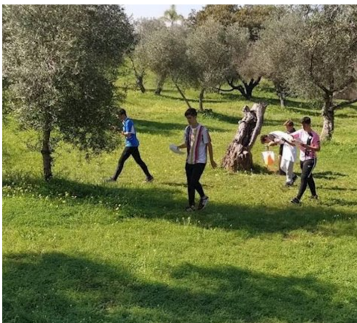
Espacio para la orientación en Dos Hermanas

Dos Hermanas (Sevilla) desarrollará un circuito permanente para practicar la orientación en el parque Dehesa Doña María