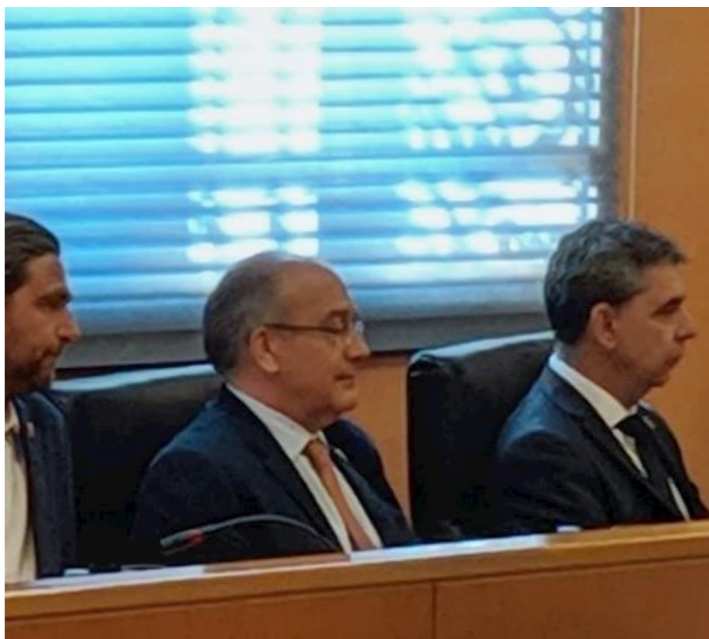
Grupo de Cs en Dos Hermanas - CS

Cs Dos Hermanas (Sevilla) lleva a pleno la creación de una oficina de apoyo a comercio, autónomos y pequeños empresarios