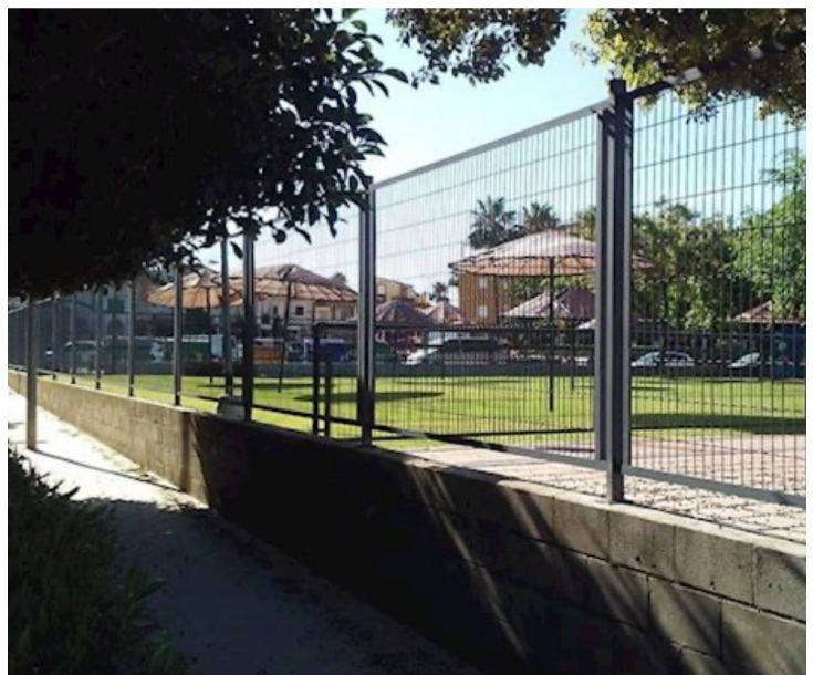
Instalaciones deportivas de Dos Hermanas - DOS HERMANAS